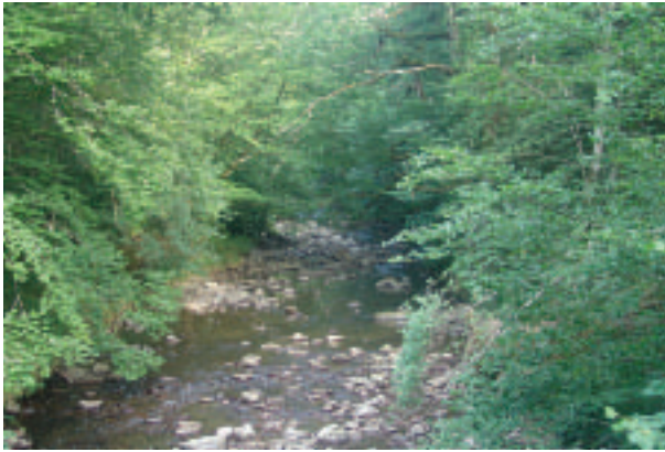
FOTOGRAFÍA 1. Río Iratí en Navarra. Tipología de río pirenaico calizo, de mediano tamaño, régimen pluvial, substrato de gravas con formación de rápidos y remansos, con alisadas de elevado porte.