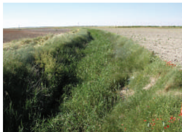
FOTOGRAFÍA 14. Ribera en estado muy pobre (Río Saona).