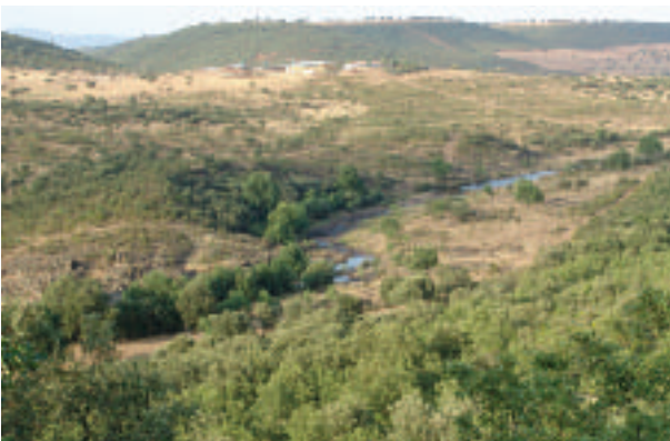
FOTOGRAFÍA 4. Valle Tipo II: R. Estena (Toledo).