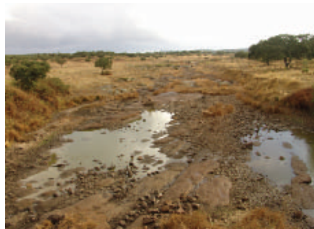
FOTOGRAFÍA 13. Ribera en estado pobre (Rib. Albarragena).