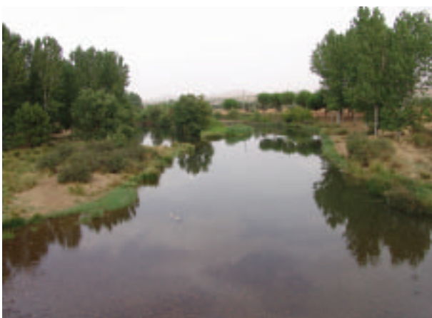
FOTOGRAFÍA 11. Ribera en estado regular (Río Bullaque).