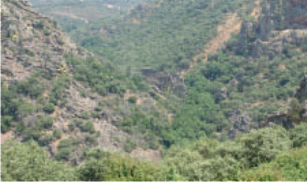
FOTOGRAFÍA 3. Valle Tipo I: Río Guadarranque (Cáceres).

gitudinal intermedia o baja, generalmente en cauces pequeños o de tamaño medio. La sinuosidad del río puede ser elevada, ligada a los procesos fluviales que tienen lugar actuando sobre materiales sueltos de origen glaciar.