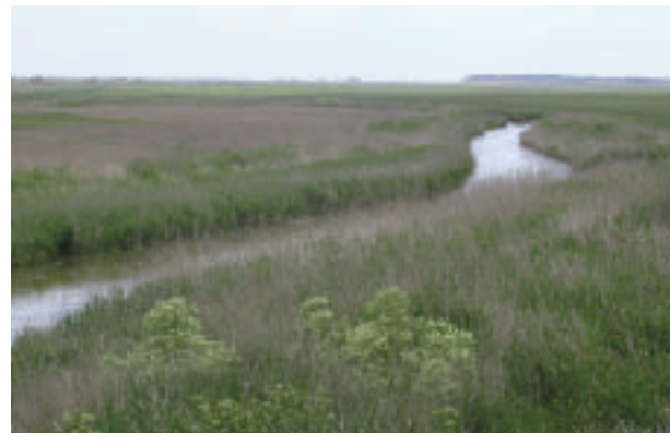
FOTOGRAFÍA 6. Valle Tipo IV: Río Ciguela (Ciudad Real).