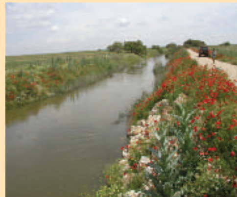
FOTOGRAFÍA 8. Orillas rectificadas, con gran homogeneidad de las condiciones hidráulicas y pérdida de diversidad de hábitats (Río Cigueta, Ciudad Real).