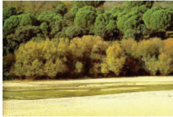
FOTOGRAFÍA 2. Río Alberche en Madrid. Tipología de río de llanura de la región Luso-Extremadurensis, silíceo, de tamaño grande, régimen pluvial, substrato de arenas, y riberas orladas de saucedas arbóreas mixtas.