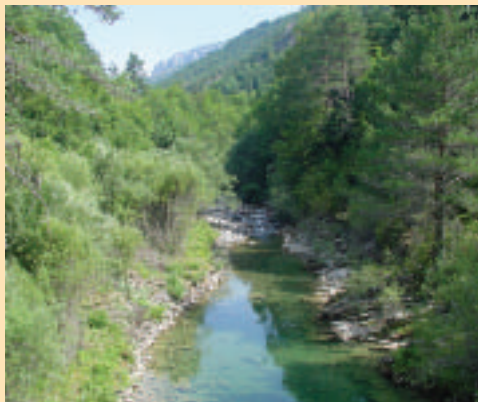
FOTOGRAFÍA 7. Orillas en condiciones naturales, con diversidad de condiciones hidráulicas y heterogeneidad del hábitat (Río Veral, Huesca).

Considerar nivel de "bankfull" el que alcanzan las avenidas ordinarias, a partir del cual generalmente se observa un cambio de pendiente en el talud de las orillas y se observa el desarrollo de una vegetación riparia leñosa, asentada sobre suelos no permanentemente saturados. Ponderar el nivel de erosión de origen antrópico en función de la frecuencia e intensidad de los síntomas de inestabilidad de las orillas (acumulación de sedimentos en la base de las orillas, presencia de grietas, desmoronamientos, descalzamiento de raíces, etc.), y del porcentaje de suelo desnudo en contacto con la lámina de agua, sin ningún tipo de cobertura vegetal. Considerar estado natural cuando estos síntomas correspondan a la dinámica natural del cauce.