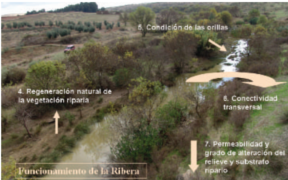
FIGURA 2. Atributos que caracterizan el funcionamiento hidrológico de las riberas en relación al equilibrio de la vegetación riparia con el actual régimen de caudales y usos del suelo, la estabilidad y heterogeneidad de las orillas y la conectividad lateral y vertical del cauce con sus riberas y llanuras de inundación.

2. Cada tramo de río presenta condiciones riparias de referencia distintas, en función de la morfología del valle y del cauce, su régimen de caudales y su localización biogeográfica (ver fotos 1 y 2).