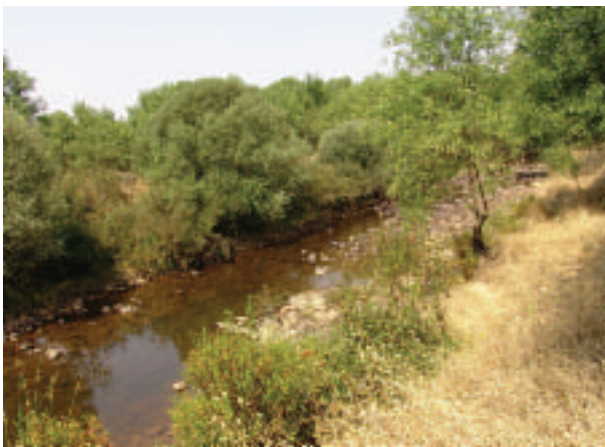
FOTOGRAFÍA 10. Ribera en estado bueno (Río Guadarranque).