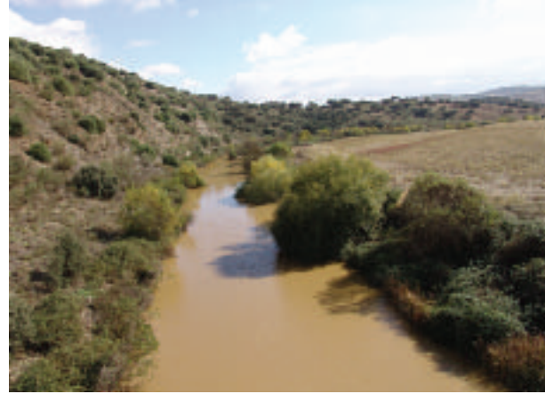
FOTOGRAFÍA 12. Ribera en estado regular (Río Matachel).