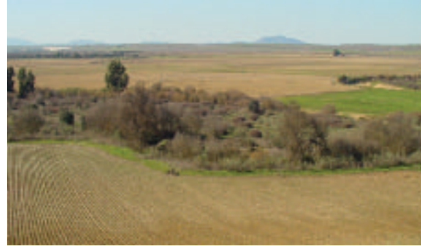
FOTOGRAFÍA 5. Valle Tipo III: Río Ruecas (Cáceres).

mos altos y medios de los cauces que discurren por terrenos de sierras y montañas bajas, o en tramos medios de ríos montañosos, donde todavía queda sin configurar la llanura de inundación del cauce principal. La anchura del valle es mayor que en el caso anterior y la sinuosidad del río puede estar ligada al relieve o de forma incipiente a los procesos fluviales.