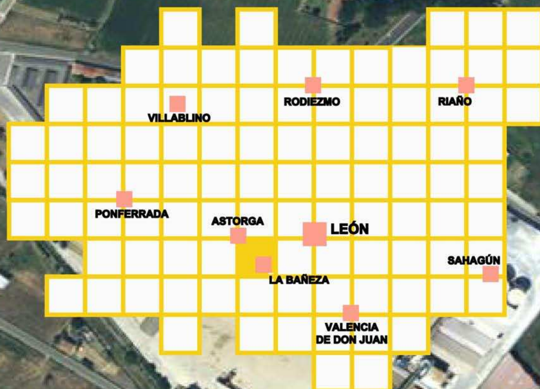
Situación en provincia de León