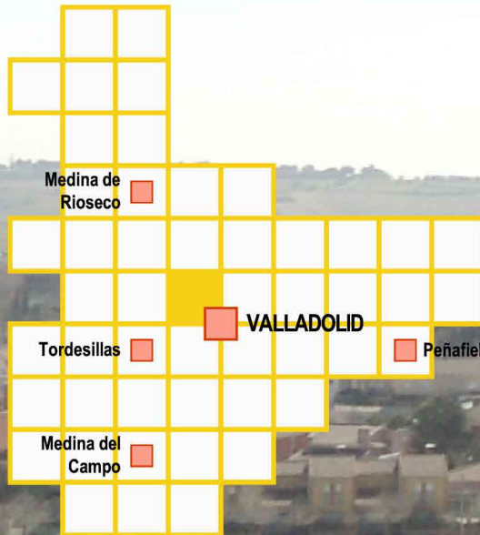
Situación en provincia de Valladolid

Los terrenos objeto del proyecto se localizan en el término municipal de Fuensaldaña (Valladolid).