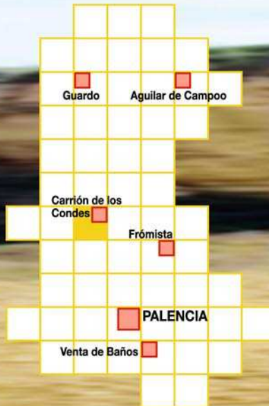
Situación en provincia de Palencia

Los terrenos objeto del proyecto se localizan en el término municipal de Carrión de los Condes (Palencia).