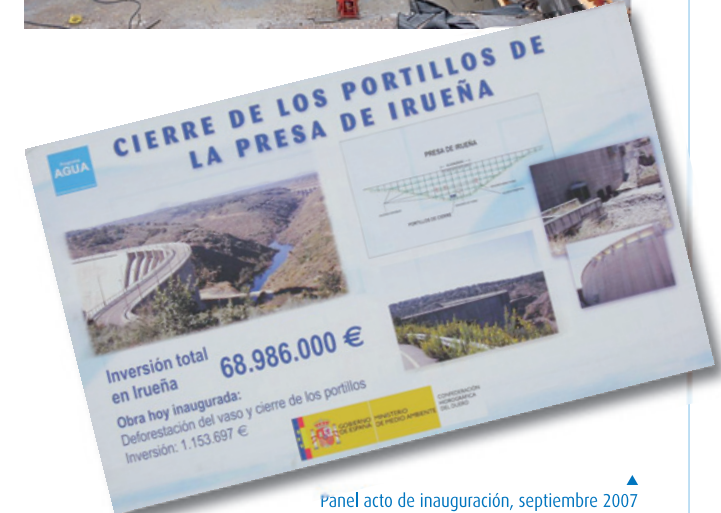
Panel acto de inauguración, septiembre 2007