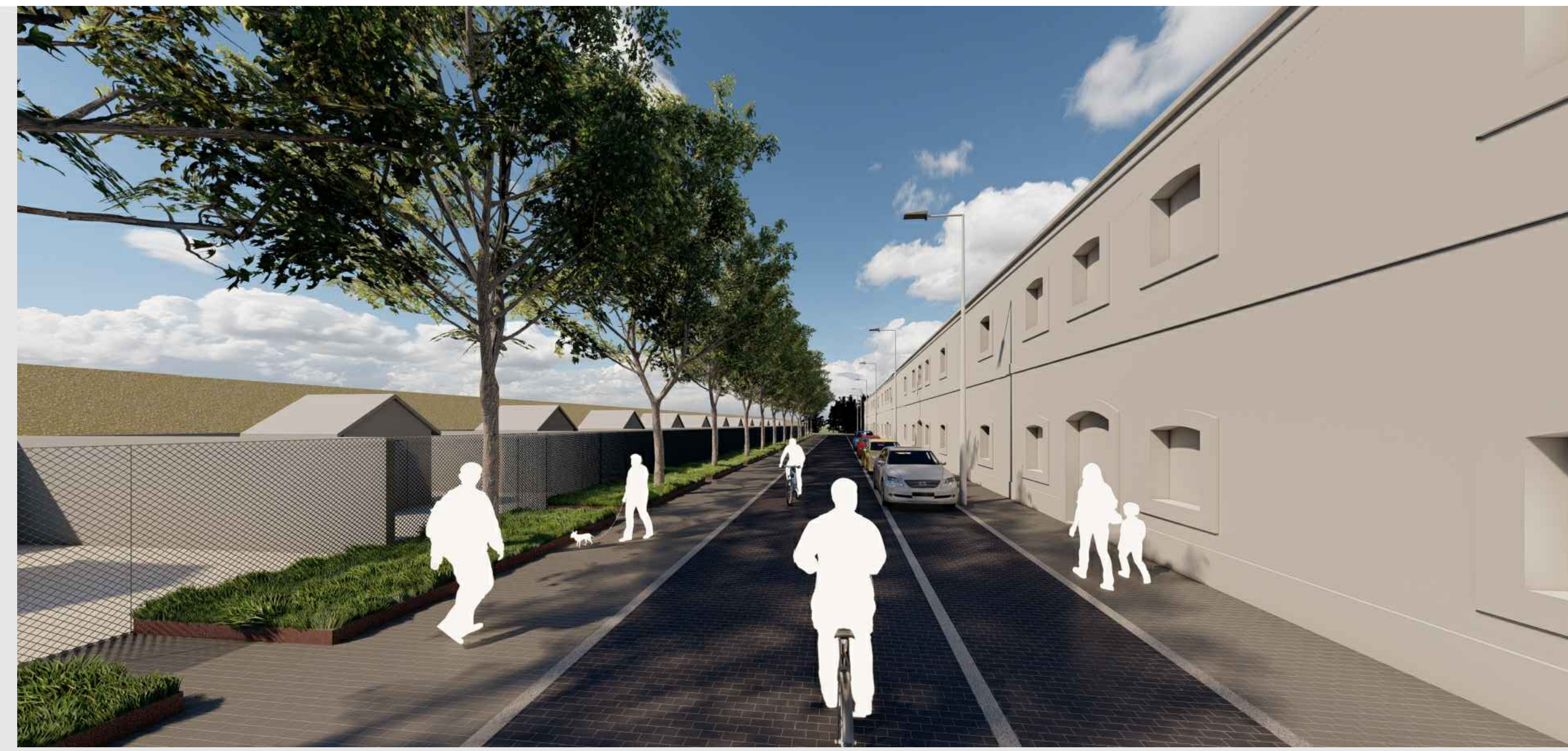
CALLE DE COEXISTENCIA