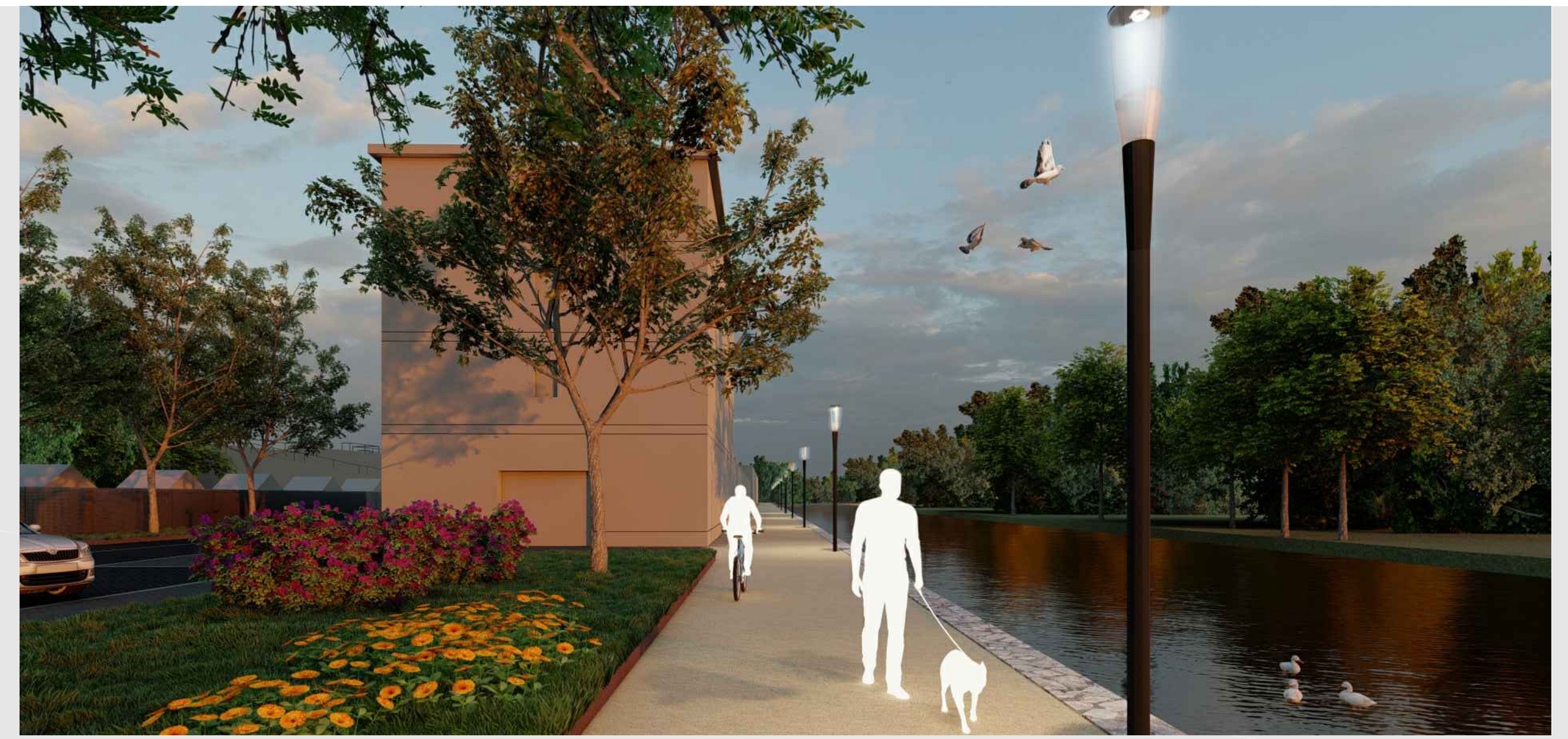
CAMINO DE SIRGA