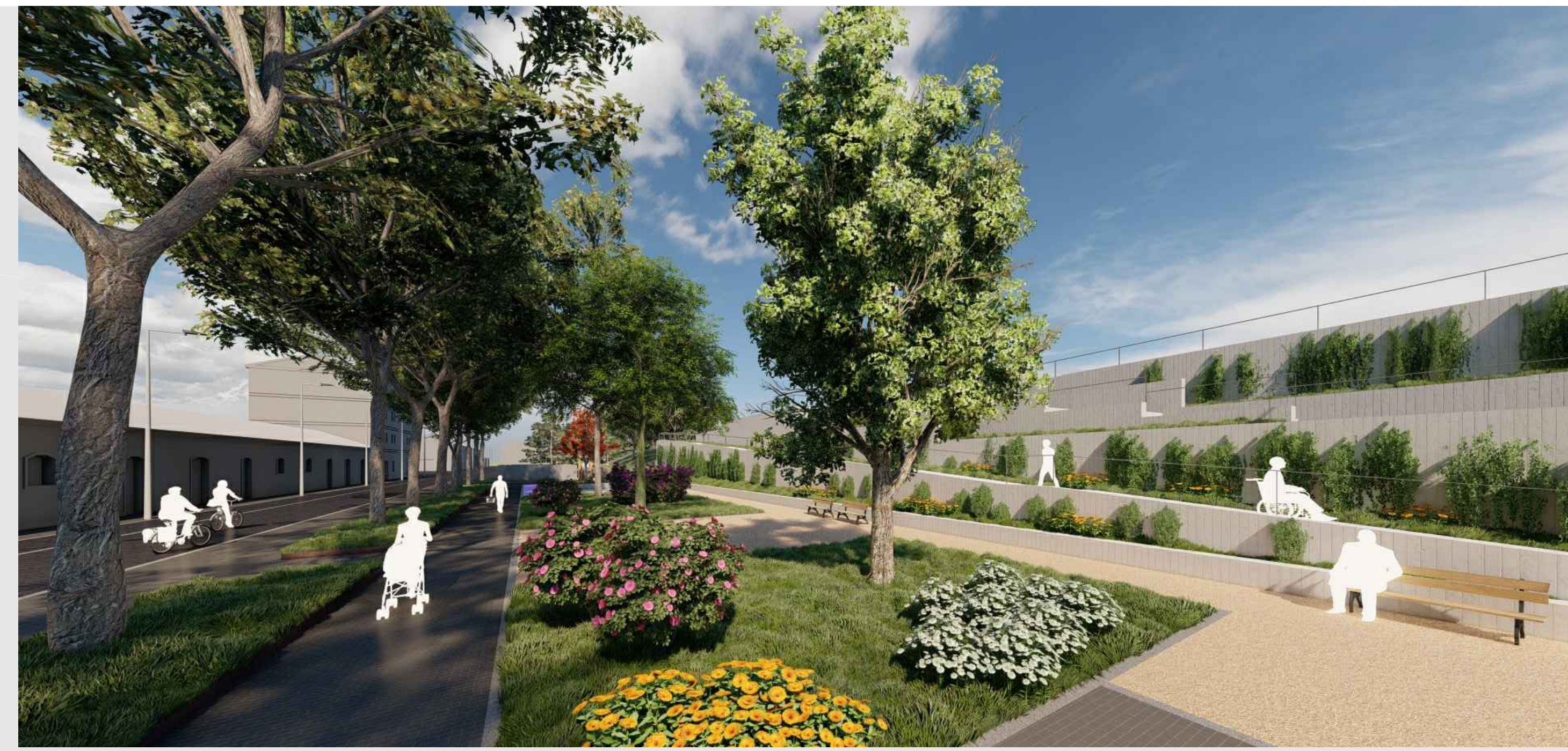
JARDINES DE LA PLAZA