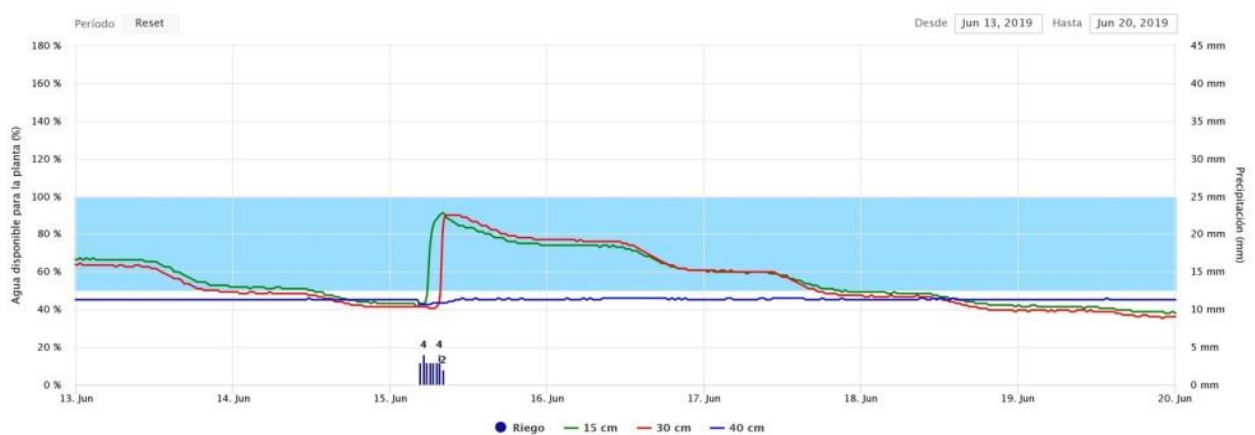
Gráfico 3: Evolución de la lámina de agua aplicada en un riego con dosis ajustadas a las necesidades del cultivo, en este caso remolacha.

En estos dos casos se puede ver cómo se aplican riegos que elevan la humedad del suelo en la zona radicular (15 y 30 cm de profundidad, líneas verde y roja respectivamente) sin que aumente la humedad a 40 cm de profundidad (línea azul), por tanto, no hay percolación y no se produce lixiviación de nitratos. Estos datos nos