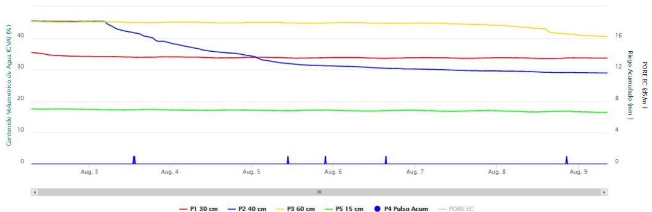
Gráfico 1: Evolución de la lámina de agua aplicada en un riego con dosis de RIEGO A MANTA (TRADICIONAL) en un girasol en Santoyo (Palencia)

Es difícil demostrar cuanto influye la agricultura en la generación de dicha contaminación y cuanto otros factores como podrían ser las depuradoras que vierten directamente en los cauces. Pero si analizamos los siguientes datos: