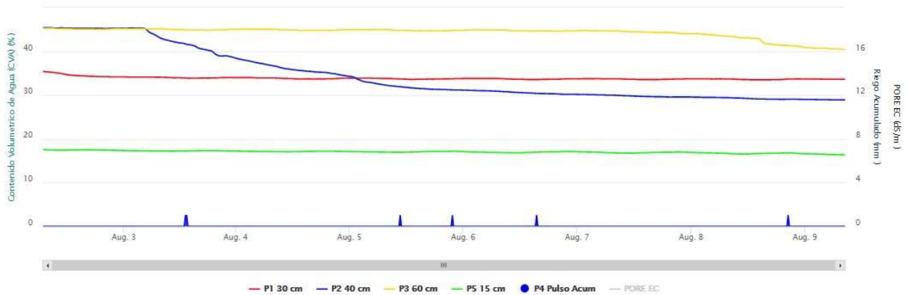
Gráfico 1: Evolución de la lámina de agua aplicada en un riego con dosis de un RIEGO A MANTA (TRADICIONAL) en un girasol en Santoyo (Palencia)