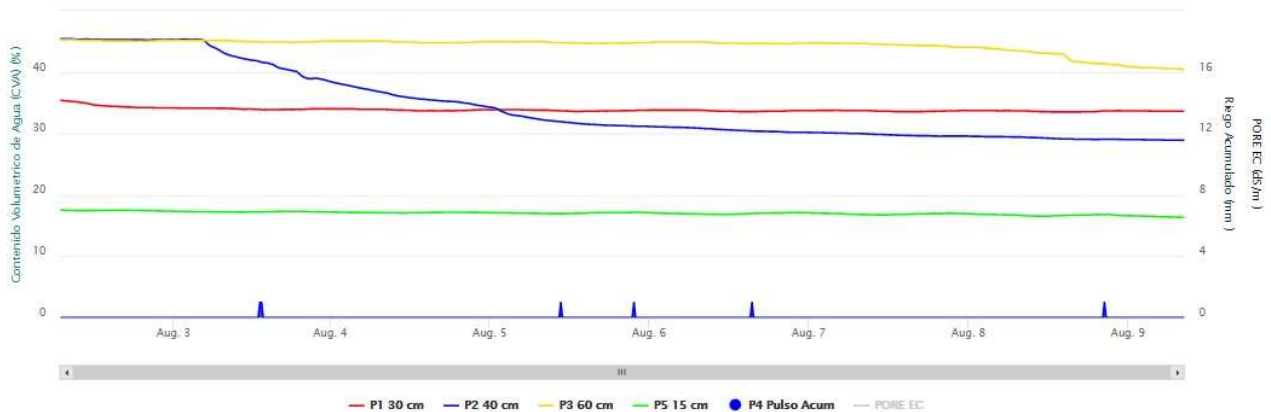
Gráfico 1: Evolución de la lámina de agua aplicada en un riego con dosis de un RIEGO A MANTA (TRADICIONAL) en un girasol en Santoyo (Palencia)