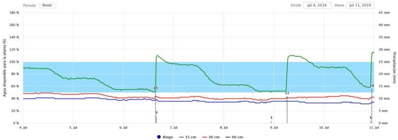
Gráfico 2: Evolución de la lámina de agua aplicada en un riego con dosis ajustadas a las necesidades del cultivo, en este caso maíz.