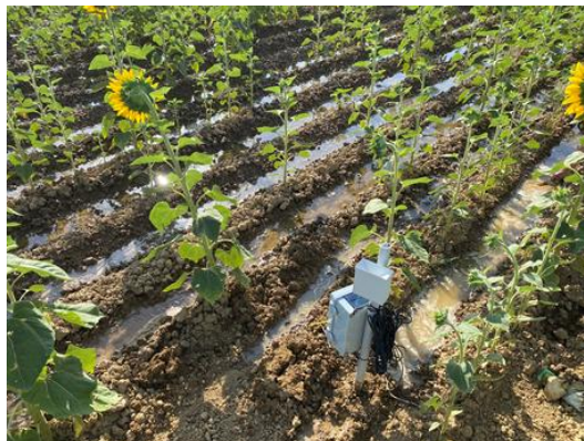
Foto 1: Equipo de Sonda de Humedad instalado por la C.R. Canal del Pisuerga. Riego a manta en Girasol.