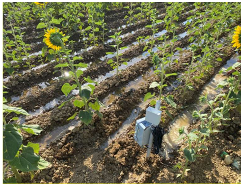
Foto 1: Equipo de Sonda de Humedad instalado por la C.R. Canal del Pisuerga. Riego a manta en Girasol.

En este gráfico observamos claramente como el agua llega a los 60 cm de profundidad (sonda de color amarillo) y alcanza niveles por encima de saturación con los arrastres que conllevan al subsuelo.