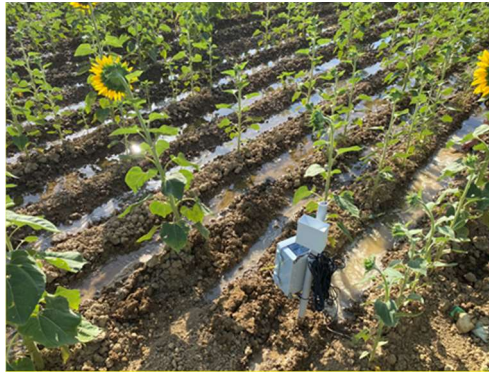
Foto 1: Equipo de Sonda de Humedad instalado por la C.R. Canal del Pisuerga. Riego a manta en Girasol.

En este gráfico observamos claramente como el agua llega a los 60 cm de profundidad (sonda de color amarillo) y alcanza niveles por encima de saturación con los arrastres que conllevan al subsuelo.