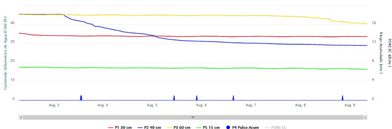
Gráfico 1: Evolución de la lámina de agua aplicada en un riego con dosis de un RIEGO A MANTA (TRADICIONAL) en un girasol en Santoyo (Palencia)

Es difícil demostrar cuanto influye la agricultura en la generación de dicha contaminación y cuanto otros factores como podrían ser las depuradoras que vierten directamente en los cauces. Pero si analizamos los siguientes datos: