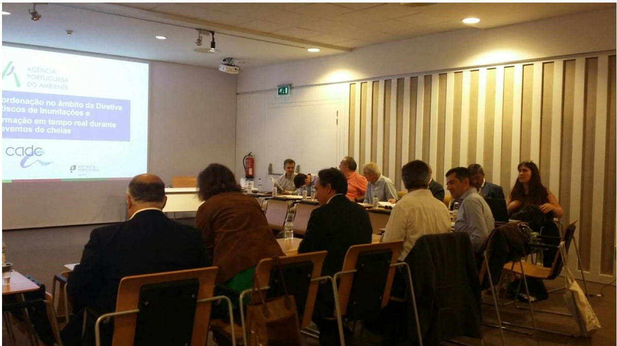
Imagen de la reunión entre las delegaciones portuguesa y española celebrada los días 5-6 de julio de 2018 en Oporto

Uno de los resultados de la reunión de Évora fue la propuesta de creación de un grupo específico de trabajo España-Portugal para la implantación de la Directiva de Inundaciones acordándose la celebración en Oporto de una reunión los días 5-6 de julio de 2018 para mejorar la coordinación internacional en el marco de la Directiva de Inundaciones e intercambiar información en tiempo real en episodios de avenida entre ambos países.