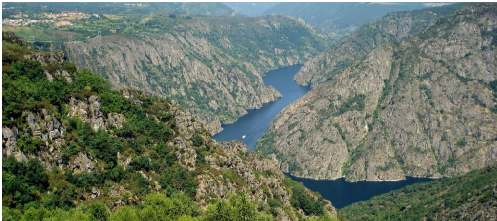
Río Duero/Douro en la demarcación internacional

Duero, que forma el espectacular cañón de los Arribes a lo largo de unos 100 km en su caída desde la meseta castellana a las tierras bajas portuguesas.