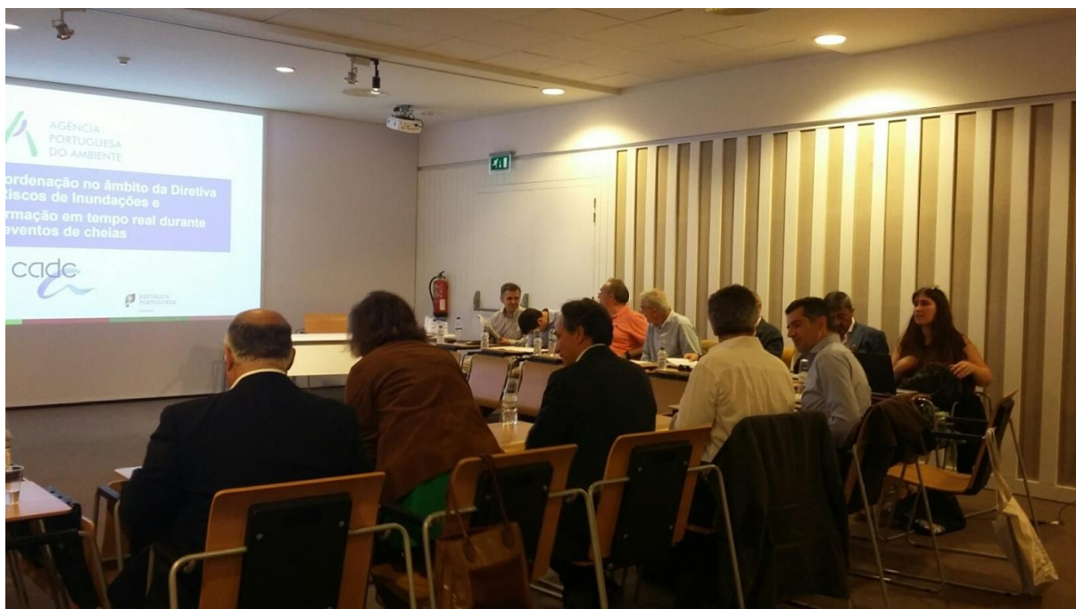
Imagen de la reunión entre las delegaciones portuguesa y española celebrada los días 5-6 de julio de 2018 en Oporto

Uno de los resultados de la reunión de Évora fue la propuesta de creación de un grupo específico de trabajo España-Portugal para la implantación de la Directiva de Inundaciones acordándose la celebración en Oporto de una reunión los días 5-6 de julio de 2018 para mejorar la coordinación internacional en el marco de la Directiva de Inundaciones e intercambiar información en tiempo real en episodios de avenida entre ambos países.