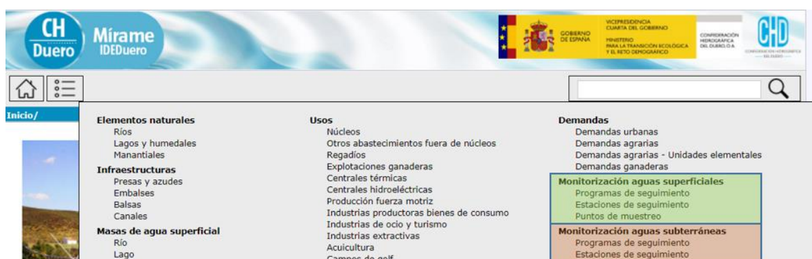
Figura 1. Pantalla del Sistema de Información de la CHD mostrando el despliegue de las redes de seguimiento del estado de las masas de agua

Este sistema de información, además de constituir un elemento básico para la planificación y elaboración de los programas de medidas se utilizará para el seguimiento del Plan Hidrológico.