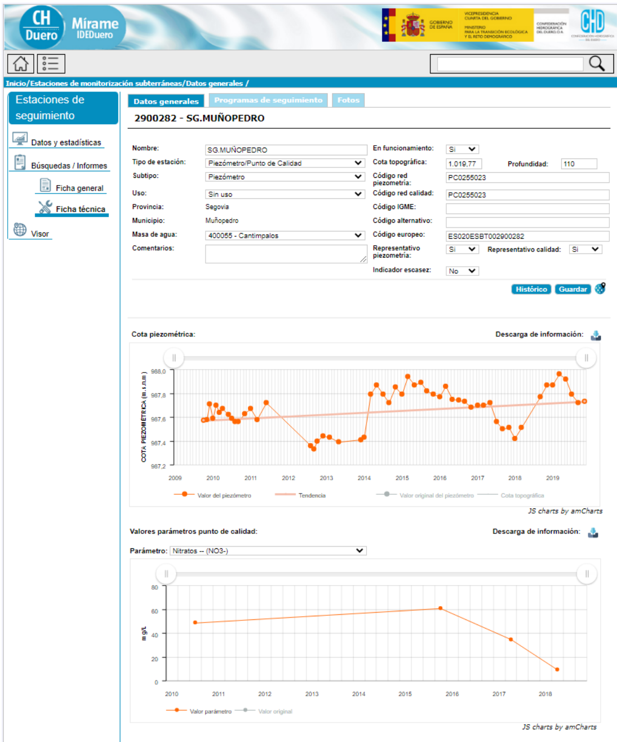
Figura 3. Acceso a través de Mirame-IDEDuero a la información relativa a las estaciones de seguimiento del estado. Ejm: Estación 2900282. Ficha técnica-Datos generales.