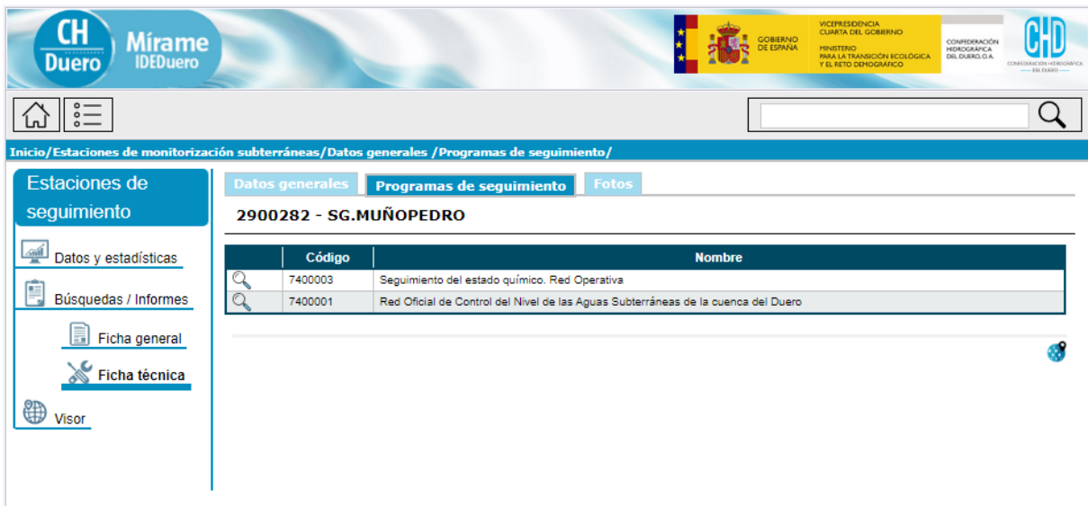
Figura 4. Acceso a través de Mírame-IDEDuero a la información relativa a las estaciones de seguimiento del estado. Ejm: Estación 2900282. Ficha técnica-Programas de seguimiento.

Se muestra en la Tabla 1 el listado de las estaciones de control de las masas de agua superficial indicando la masa de agua superficial que es controlada por esta estación, mientras que en la