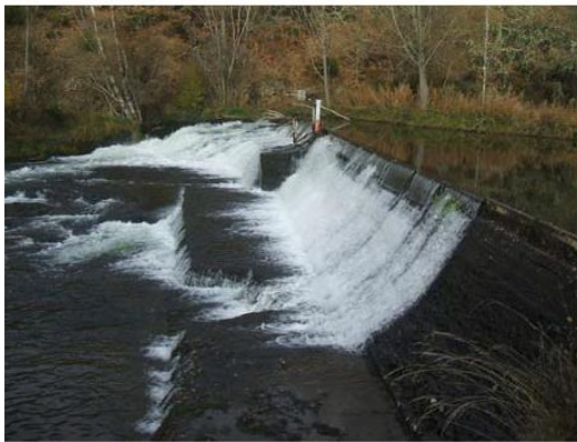
AZUD DE TOMA. VISTA DESDE LA MARGEN IZQUIERDA.