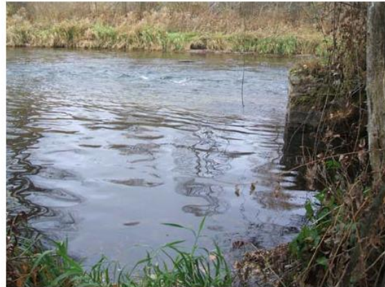
RESTITUCIÓN AL CAUCE.