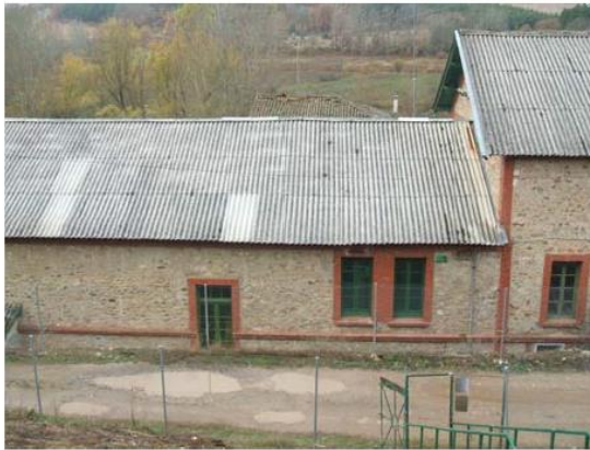
EDIFICIO DE LA CENTRAL.