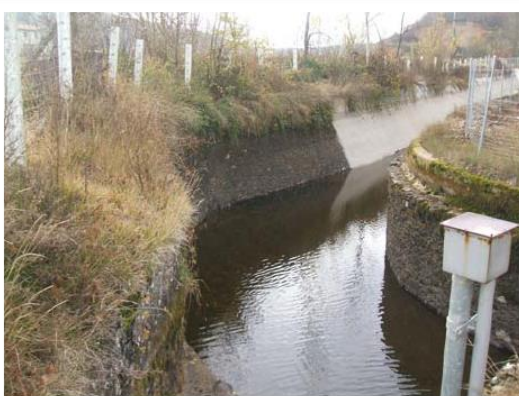
TRAMO INICIAL DEL CANAL DE DERIVACIÓN.