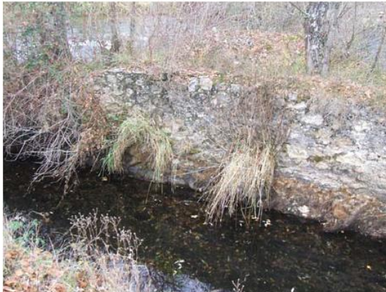
CANAL DE RESTITUCIÓN.