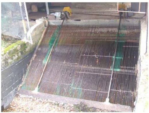
ENTRADA A LA CÁMARA DE CARGA.