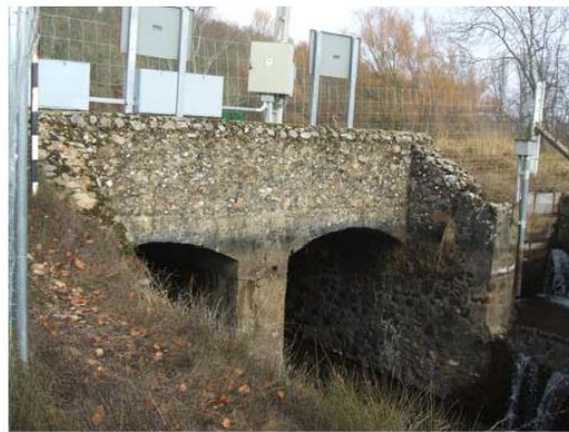
OBRA DE TOMA DESDE AGUAS ABAJO.