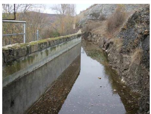
TRAMO FINAL DEL CANAL DE DERIVACIÓN.